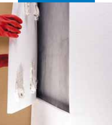
Точечное приклеивание изолирующих материалов