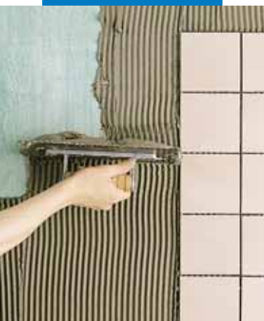
Укладка плитки на гипс, обработанный грунтовкой Primer G