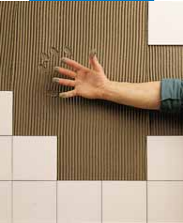
Время использования клея еще не истекло

Руки и инструменты очищаются обильными количествами воды. Облицованные поверхности протрите влажной тряпкой.