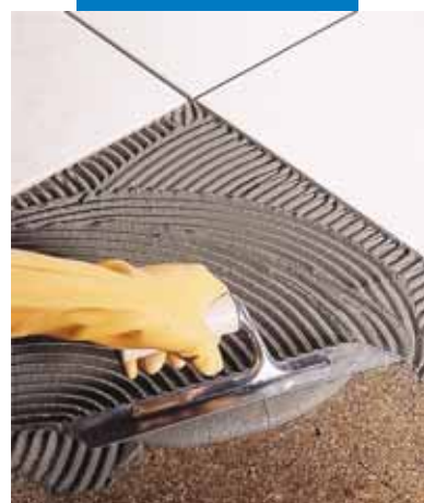
Укладка плитки одинарного обжига на изолирующий пробковый слой

Прим.: технические данные клея Kerabond , затворенного на латексной добавке Isolastic , приведены в технической спецификации Isolastic .