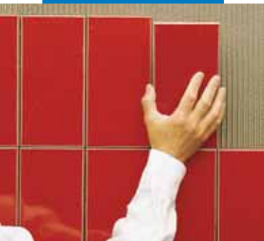
Укладка плитки на стену

Список значимых объектов, где использовался данный материал доступен по запросу и на сайтах www.mapei.ru и www.mapei.com