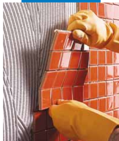
Укладка керамической мозаики на стену