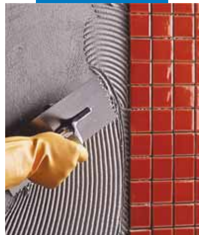
Укладка керамической мозаики на стену