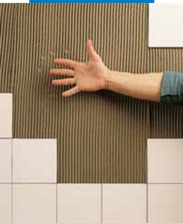
Время использования клея истекло